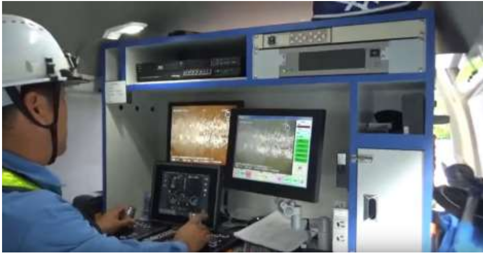
写真：TVカメラ車 車内操作中